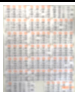
諫早本校に合格者全員の氏名を掲示