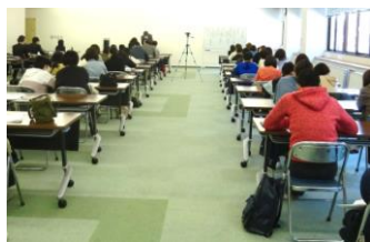
昨年度の合格報告会の様子

この報告会では、「合格するためには何点取ればいいのか」「合格するにはどういう勉強をすればいいのか」など、皆様が思っている疑問にぜひお答えいたします。また、今年合格した生徒に体験談を語ってもらう予定です。「合格するのにどのように取り組んだのか」など、生徒の生の声をお聞き下さい。今年もコロナ感染予防のため人数を制限し、1家族2名までの参加とさせていただきます。参加御希望の方はホームページの申し込みフォームからお申し込み下さい。御予約の無い方の参加はできません。また当日は、下記のことをご遵守下さい。①マスク着用をお願いします。②当日37度以上の発熱がある場合はご参加をご遠慮下さい。